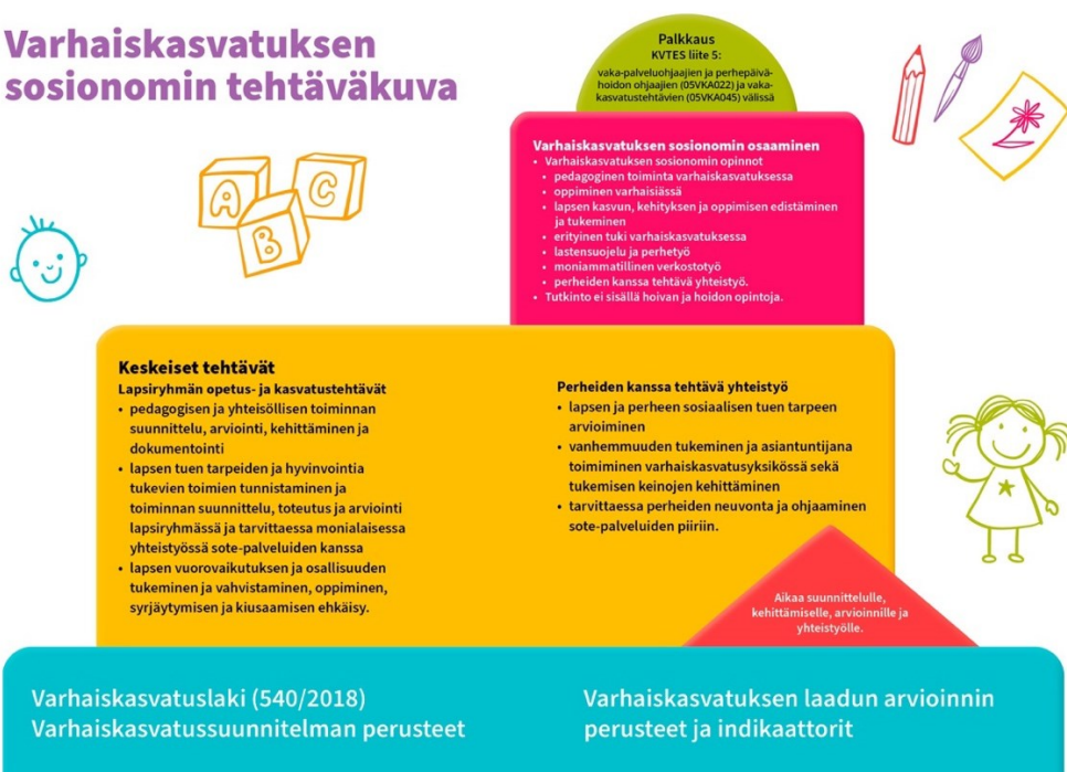
Kuvio 2. Varhaiskasvatuksen sosionomin tehtäväkuva (Talentia, i.a.)

Talentian työryhmän laatiman ohjeistuksen (Talentia, i.a.) mukaan varhaiskasvatuksen erityisosaamisaluetta on mm. tunnistaa ja arvioida lasten ja perheiden hyvinvoinnin riskitekijöitä,