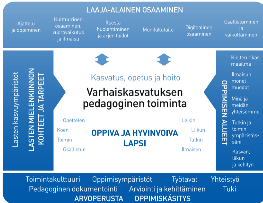
Kuvio 1. Varhaiskasvatuksen pedagoginen toiminta (OPH, 2022).

jotka edellyttävät viranomaisen puuttumista tai joissa neuvotellaan lapsen asioista. Lapsen etu ohjaa monialaista yhteistyötä ja yhteistyötä tehdään ensisijaisesti huoltajan suostumuksella.