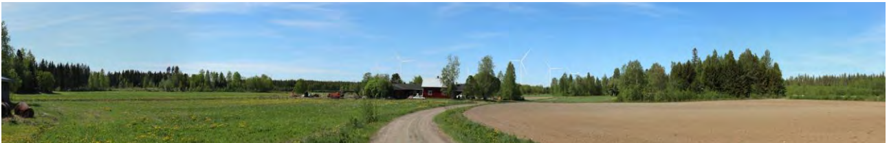
Täydentävä havainnekuva 1, Hopeavuorenmäki, VE3. Ooperin tuulivoimalat on esitetty kuvassa todellisen tilanteen mukaisina. Lähimmät voimalat erottuvat maisemassa selvästi. Tällä paikalla ne muodostuvat maisemaa hallitseviksi, muutos maisemassa erottuu suurena. Kauempana sijaitsevat voimalat jäävät tässä näkyvässä puuston katveeseen.