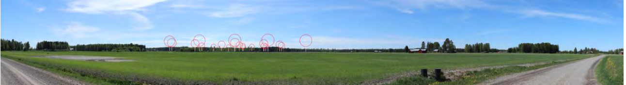
Täydentävä havainnekuva 3, Jääskänjoki, VE3. Ooperin tuulivoimalat on esitetty kuvassa punaisilla symboleilla. Kuvauspaikka sijaitsee Jääskänjoentien varressa, 3,8–4,3 km päässä lähimmistä voimaloista.

Jääskänjokivarsilla etäisyys ja maiseman avoimuus huomioiden muutokset maisemassa muodostuvat kohtalaisiksi tai suuriksi paikoilla, joilta avautuu näkymiä lounaaseen tuulivoima-alueen suuntaan. Tuulivoimaloiden lähialueilla muutokset erottuvat suurina. Etäisyyden kasvaessa maisemavaikutukset pienenevät.