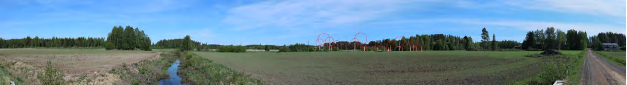
Täydentävä havainnekuva 2, Huissi, VE3. Ooperin tuulivoimalat on esitetty kuvassa punaisilla symboleilla. Kuvauspaikka sijaitsee Nahkaluoman varressa Peräkyläntiellä, 3,8–4 km päässä lähimmistä voimaloista.

Muutokset maisemassa voivat olla lähinnä tuulivoimaloita sijaitsevilla alueilla paikoin suuria ja etäisyyden ollessa suurempi kohtalaisia. Muutokset ovat maiseman peitteisyydestä johtuen paikallisia. Alueelle näkyvät lähinnä tuulivoima-alueen eteläosassa sijaitsevat voimalat. Alueen pohjoisosissa sijaitsevat voimalat jäävät metsän katveeseen.