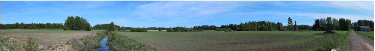
Täydentävä havainnekuva 2, Huissi, VE3. Ooperin tuulivoimalat on esitetty kuvassa todellisen tilanteen mukaisina. Lähimmät voimalat erottuvat kuvauspaikalle maisemassa taustalla ja varsin kapealla sektorilla. Tällä paikalla muutos maisemassa erottuu kohtalaisena. Valtaosa voimaloista ja piiloon metsän taakse.