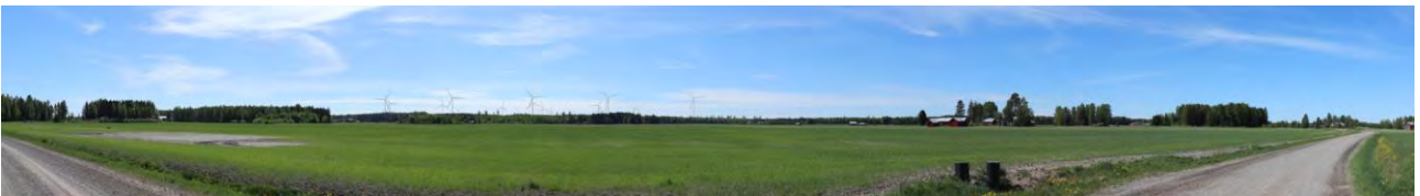
Täydentävä havainnekuva 3, Jääskänjoki, VE3. Ooperin tuulivoimalat on esitetty kuvassa todellisen tilanteen mukaisina. Ooperin tuulivoimalat erottuvat kuvauspaikalle selvästi. Tällä paikalla muutos maisemassa erottuu suurena.