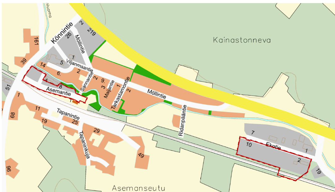
Kuva 2 Kaava-alueen rajaukset opaskartalla

29.1.2024 (päivitetty 2.4.2024, 4.9.2024)