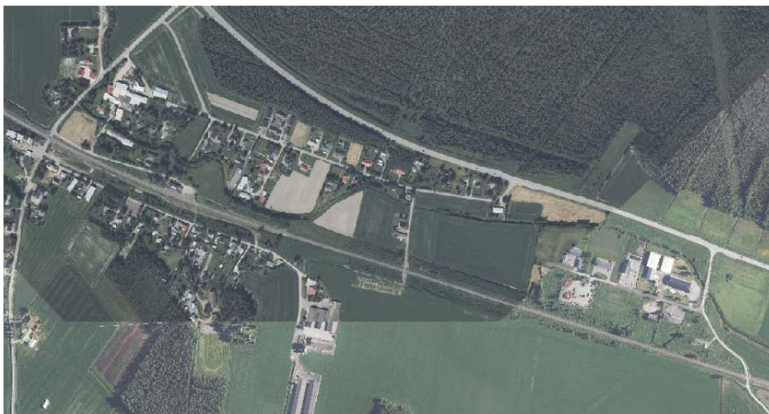
Kuva 1 Ilmakuva suunnittelualueelta.