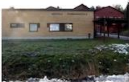
Uusi ja haasteita muuttavat Aulikkoon. Korjaus- ja terveyskeskusta säilyvät Kasperin palvelutalolla.

henkilökunnan. Viikkokoulu on rakennettu liikuntatilan varaan.