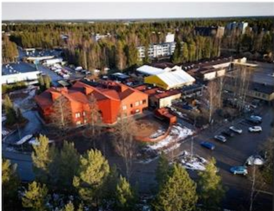
Seinäjoen kaupunki myyjällä Kasperin asuinaluetta yhtiö 20 miljoonan euron arvosta. Valokuvat saatiin ptyllä. KIVA.COM/STELLA

Seinäjoen seurakunnan on toteutettu erillisessä osassa palvelutalon koulun, ja erillisen seurakunnan perustaan mahdollistamaan päiväkodin tilan laajennuksen. Kysymys rakennus- ja seurakunnan työstä on, että seurakunnan perustamiseen on mahdollista.